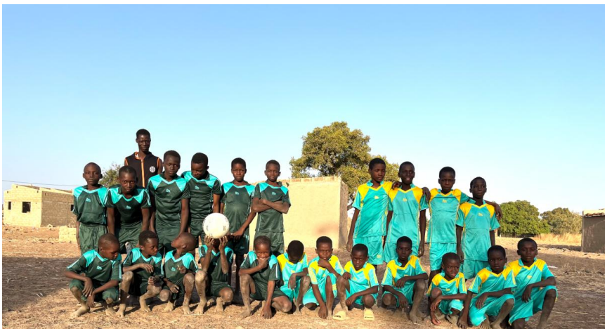
Preparados para iniciar el partido