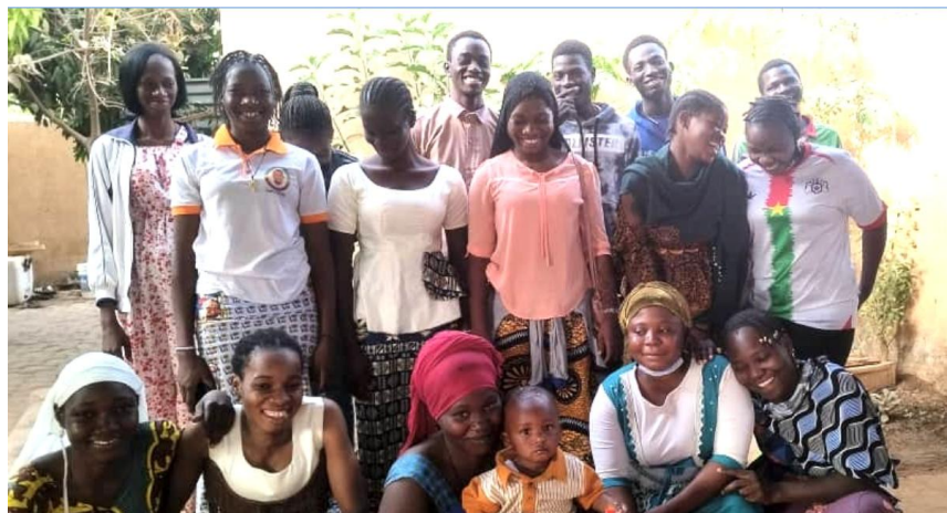
16 de los 19 universitarios activos en este momento.