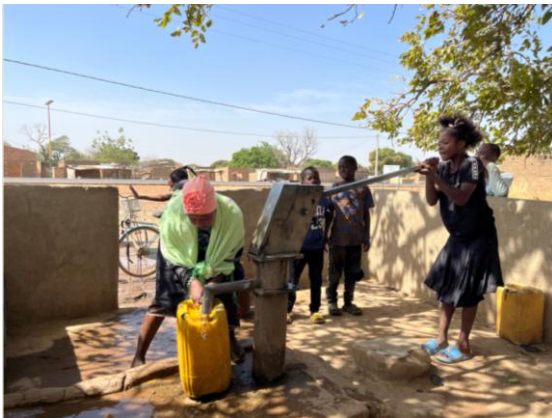
Primer pozo de Yamlaminim inaugurado en 2007

Hemos comprobado que el pozo inaugurado en 2007 sigue dando el mismo caudal de agua y este año hemos reparado una de las paredes que se había caído. En esta visita nos pidieron una pelota para jugar a fútbol, y cuando regresamos tenían ya preparada la lista con los nombres de los jugadores. Les compramos 2 equipaciones diferentes y aunque descalzos organizaron un buen partido.