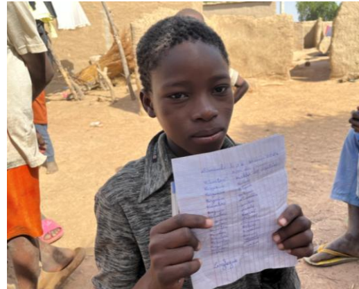
Lista de jugadores para el partido de fútbol