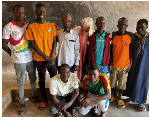
Apadrinados desplazados a Loumbila desde la zona este del país por inseguridad.